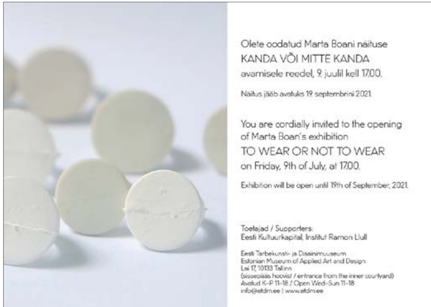
Invitació Exposició To wear or not to wear,